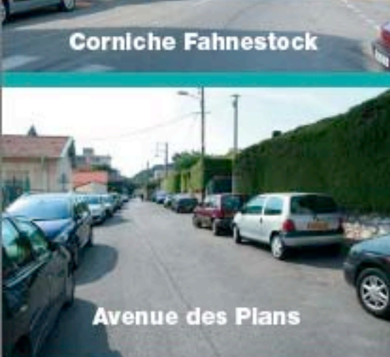
Avenue des Plans